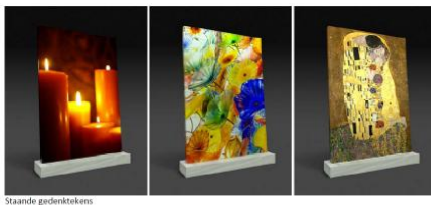
Figuur 1.1 Staannde gedenktekens Bron: Website Moments B.V. februari 2010).

Moments is een bedrijf in de fotografische dienstverlening, dat producten ontwikkelt op het gebied van fotografie & design. Moments ontwerpt duurzame gedenktekens van glas, waarin fotobeeld is verwerkt. Het idee van een print gelamineerd in glas is gebaseerd op het idee van glas-in-lood, gebruikt voor kerkramen. Het spel van het zonlicht geeft een esthetische en speelse dimensie aan het gedenkteken. Een aantal voorbeelden hiervan zijn weergegeven in figuur 1.1.