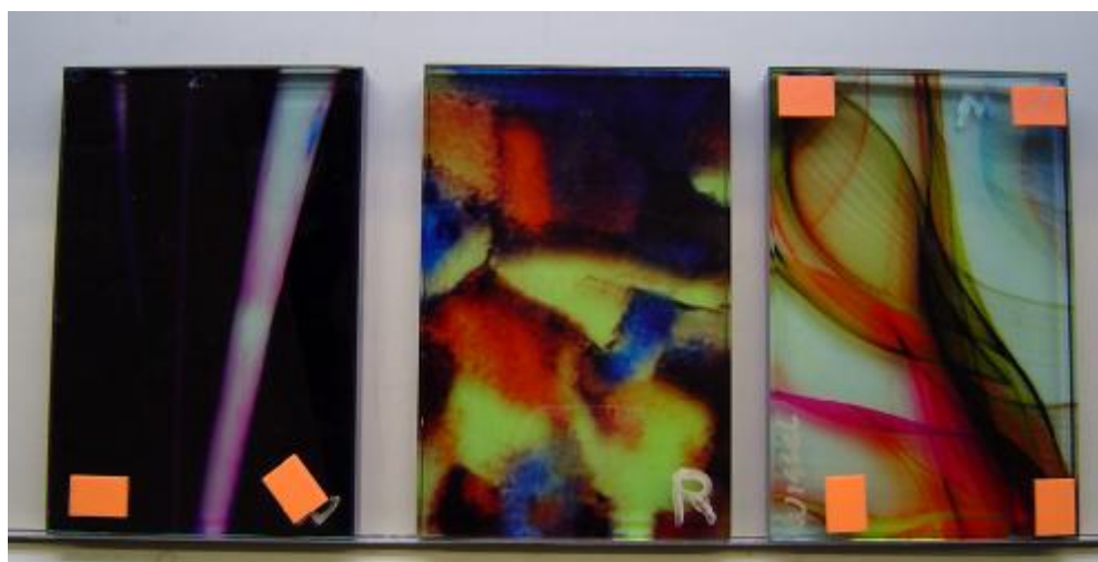
Figuur 2.2 Proefstukken na uitvoering van de klimaatwisselproef. Buitenste proefstukken zijn geëxposeerd middelste proefstuk is referentie.

De proef is gestart op 3 november 2009 en is geëindigd op 4 december 2009. In deze periode hebben de proefstukken 23 temperatuurswisselingen gehad en zaten vier weekenden.