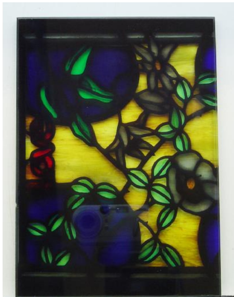
Figuur 2.1 Decoratief paneel (09-0066-1) na 6000 uur expositie in de Weather-Ometer ci 4000.